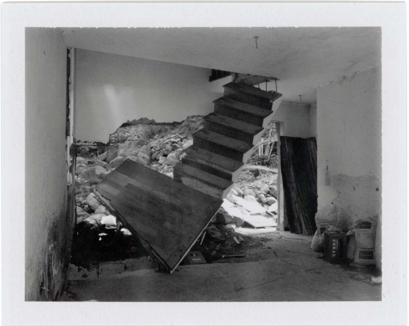
Untitled from the series Paisagem Híbrida, Projecto "Pearl" | 2017 Instant film, Fujifilm FP-3000 Bt, 10,8 x 8,6 cm (frame size 28 x 26 cm)