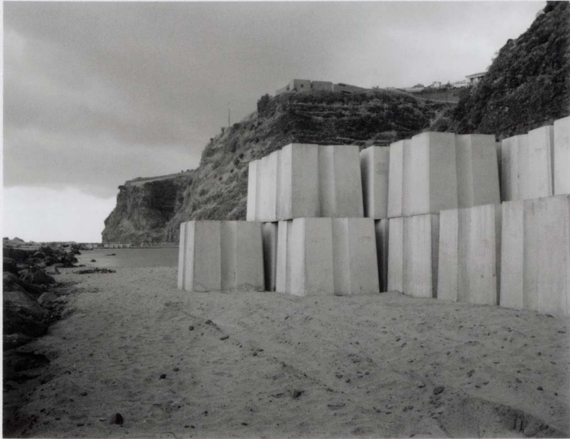
Untitled from the series Paisagem Híbrida, Projecto "Pearl" | 2017 Instant film, Fujifilm FP-3000 Bt, 10,8 x 8,6 cm (frame size 28 x 26 cm)