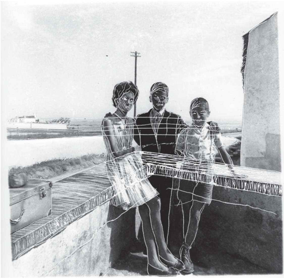
What remains of what it was - Album Cabanas | (2010 - 2011) Intervention on silver print gelatin proof, paper: 30,5x40,6 cm image:20x20cm.