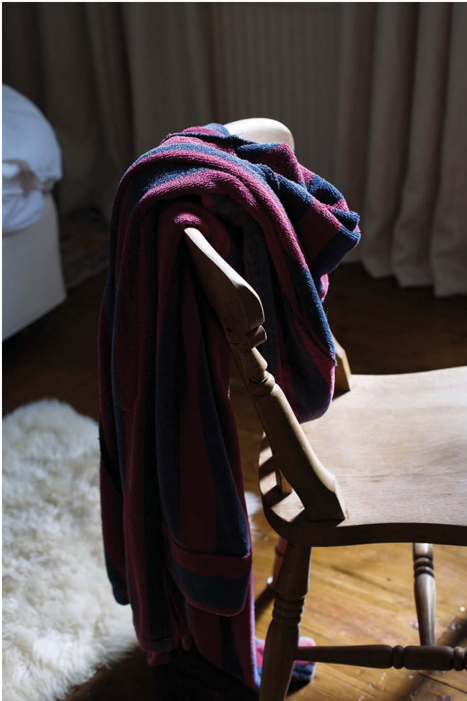
The Bedroom in English series, 2010-2018 Archival Pigment Print on Fine Art Paper, 101x75,5 cm