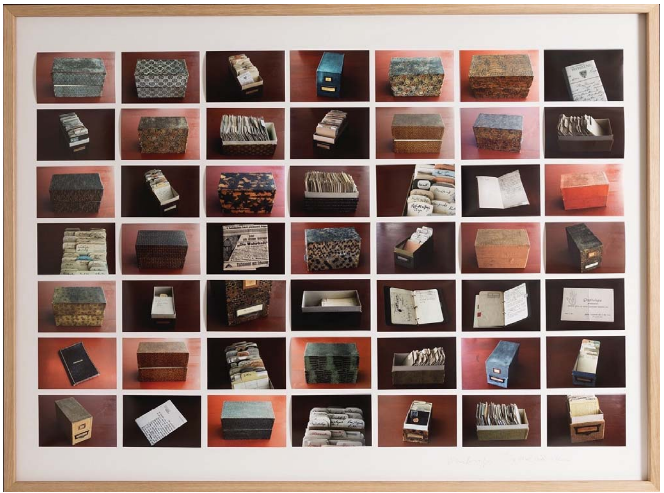
Warburgs Zettelkästen I | 2017 49 C- prints, 90 x 120 cm