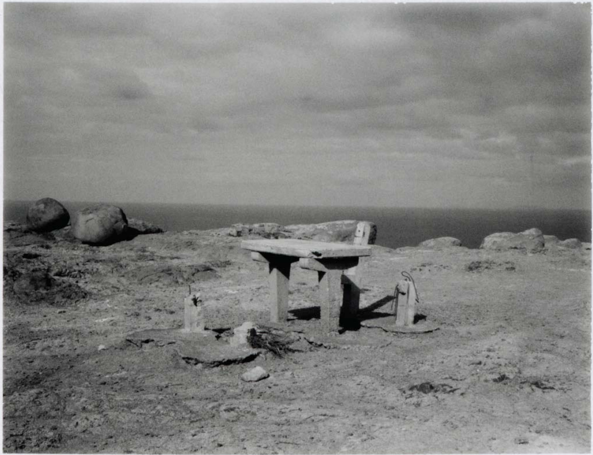
Untitled from the series Paisagem Híbrida, Projecto "Pearl" | 2017 Instant film, Fujifilm FP-3000 Bt, 10,8 x 8,6 cm (frame size 28 x 26 cm)