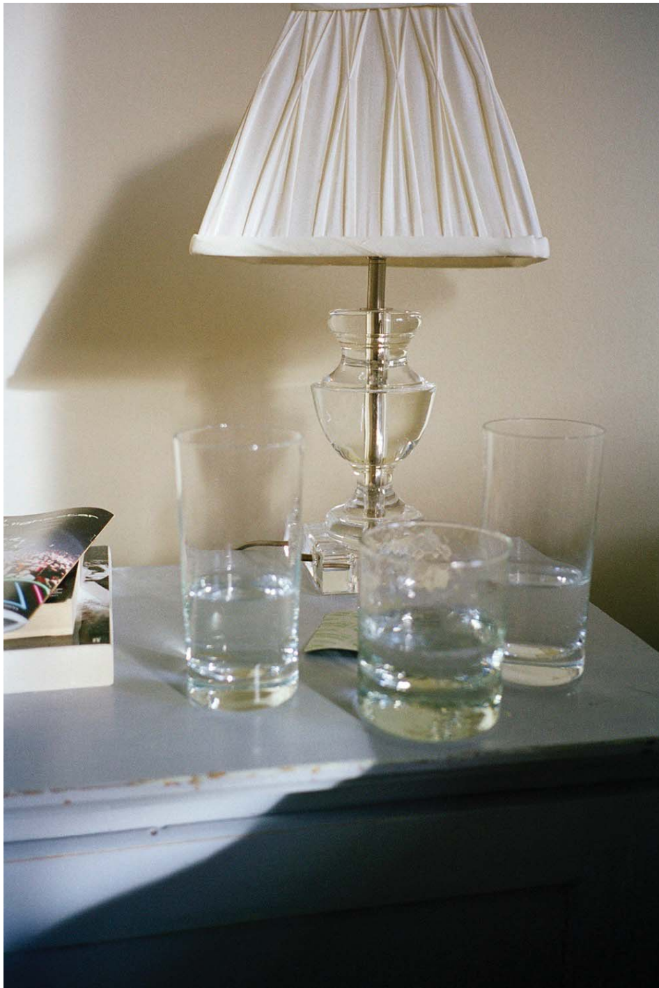
The Bedroom in English series, 2010-2018 Archival Pigment Print on Fine Art Paper, 101x75,5 cm