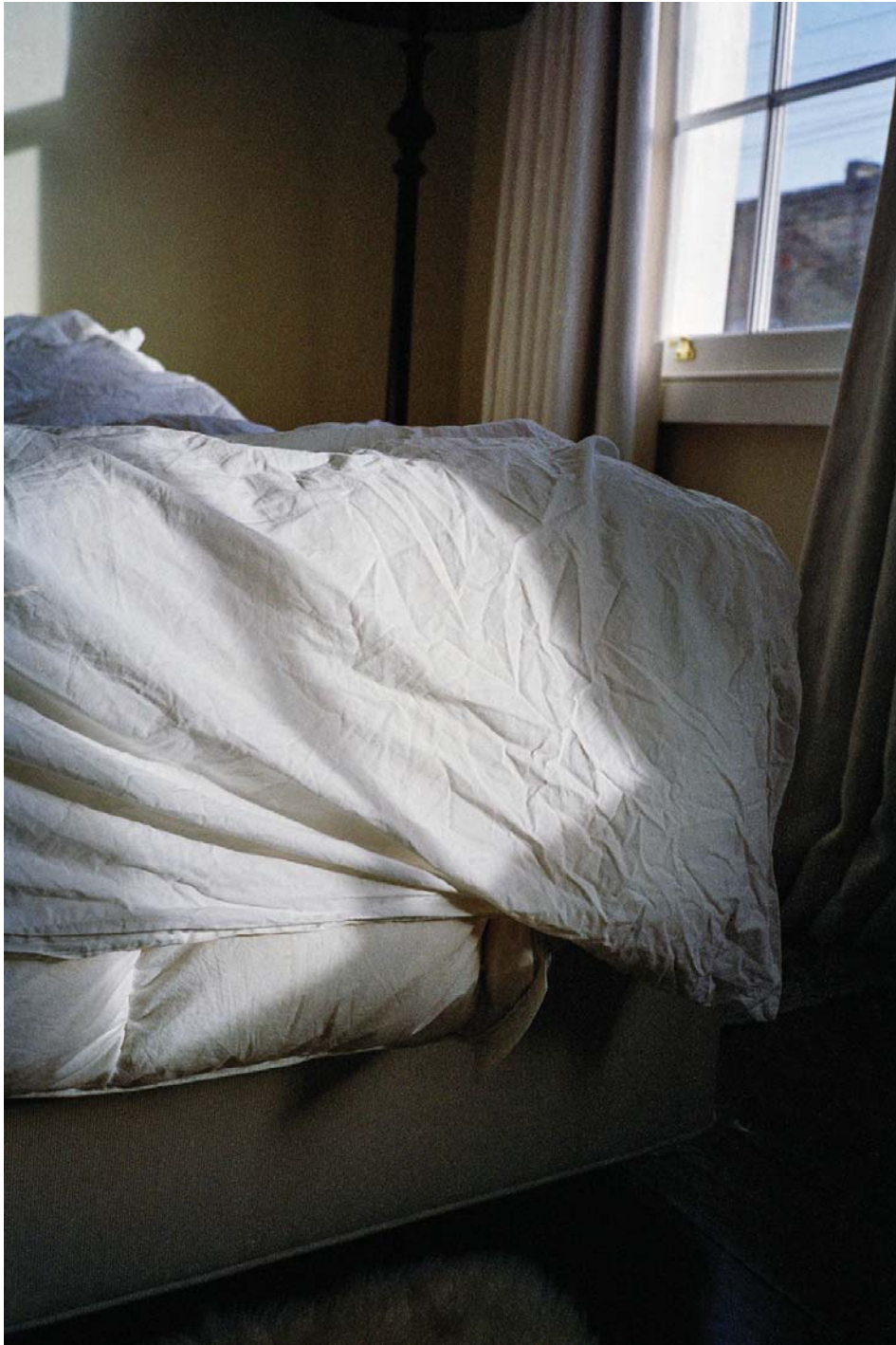
The Bedroom in English series, 2010-2018 Archival Pigment Print on Fine Art Paper, 101x75,5 cm