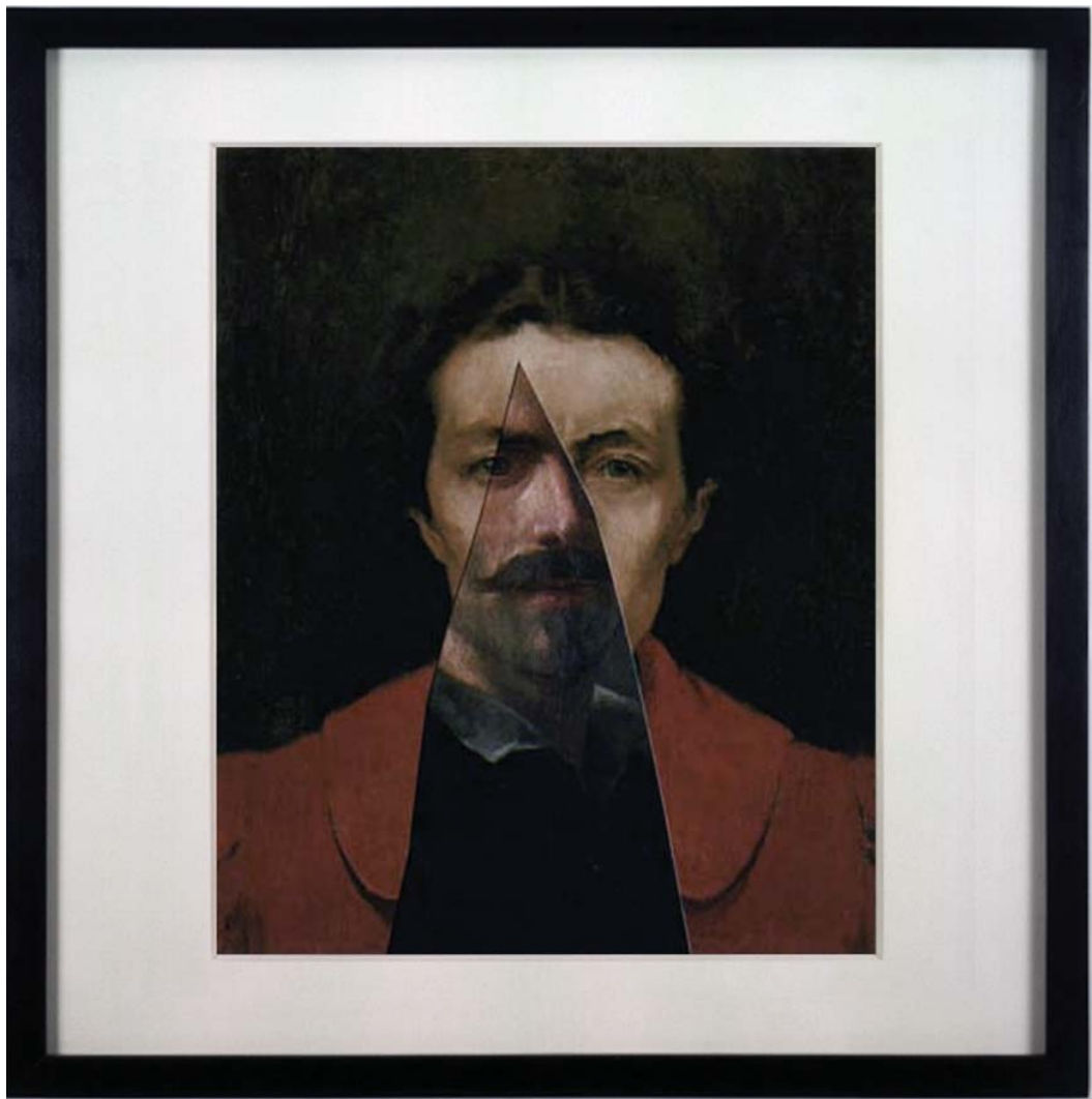
Assemblage 09, Aurelia Vs Bernini, 2007, C-print, 75 x 75 cm