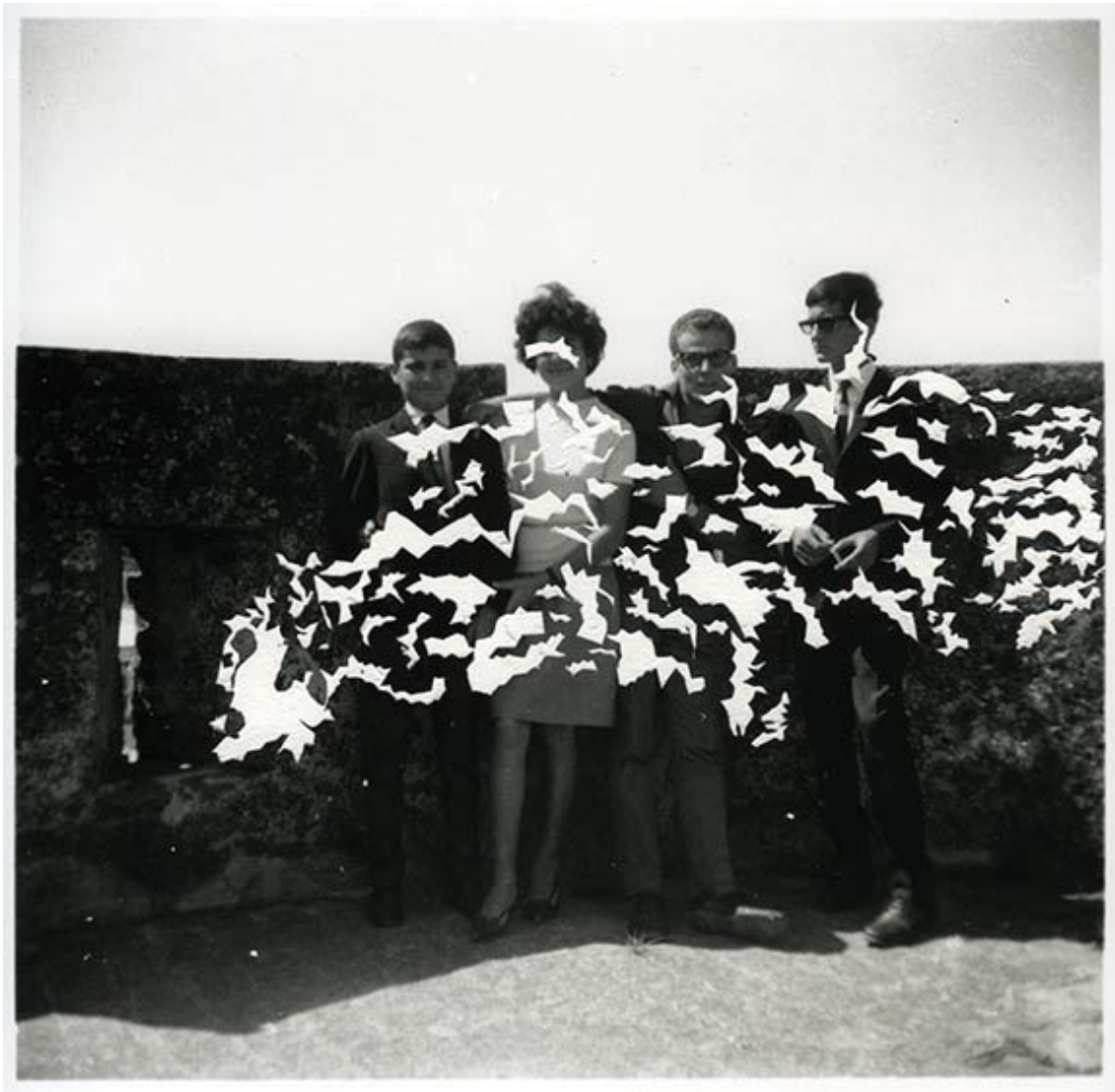
What remains of what it was - Album Cabanas | (2010 - 2011) Intervention on silver print gelatin proof, paper: 30,5x40,6 cm image:20x20cm.