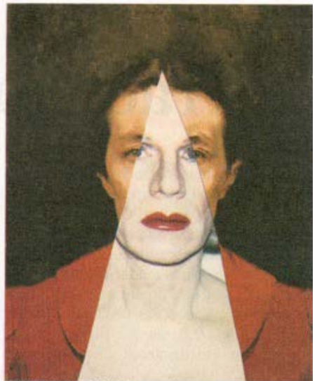
NURÉLIA DE SOUSA/ANDY WARHOL

Há um rasgão na cara, que tem que ver com uns auto-retratos