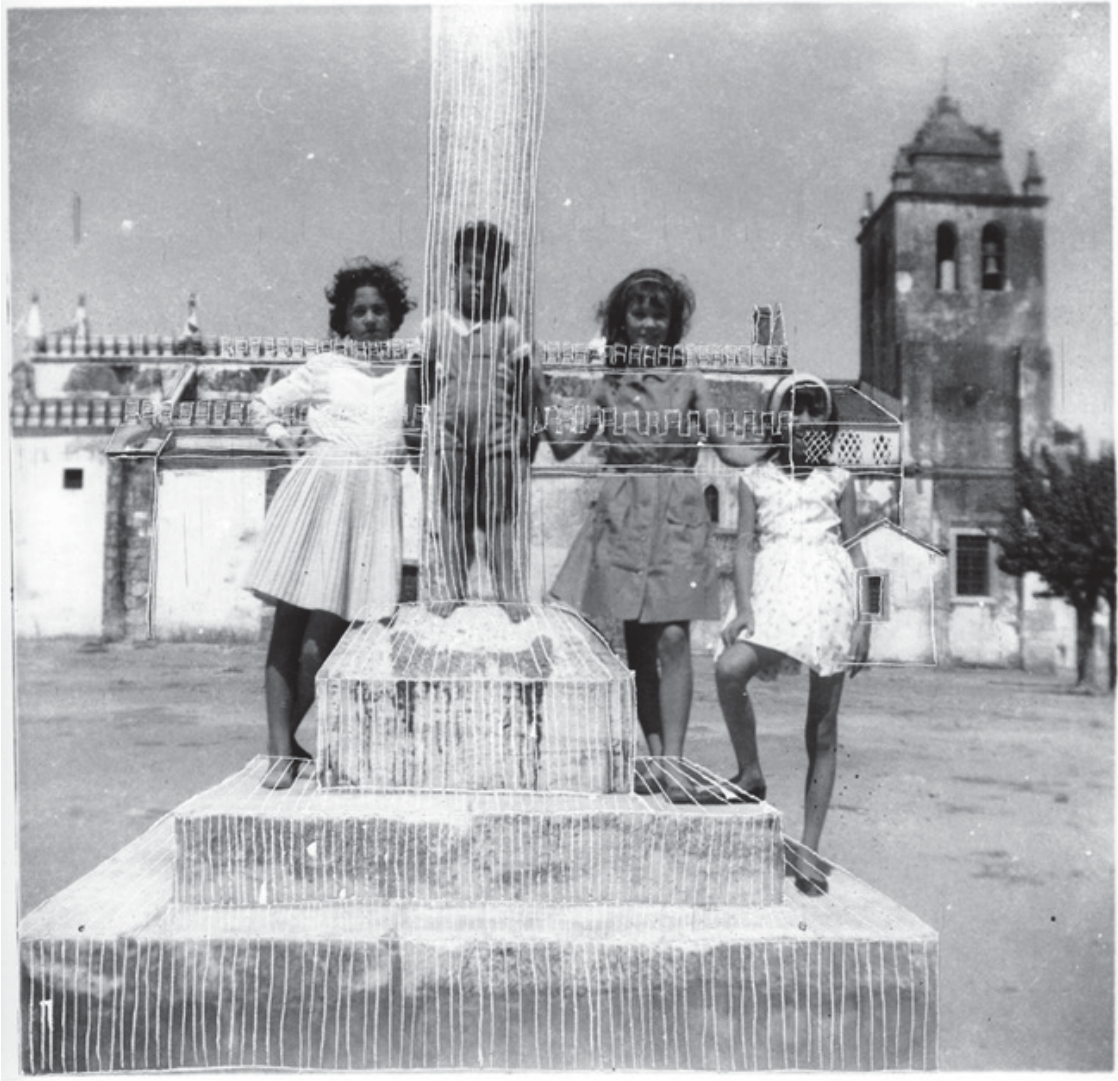
What remains of what it was - Album Cabanas | (2010 - 2011) Intervention on silver print gelatin proof, paper: 30,5x40,6 cm image:20x20cm.